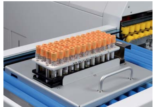
Rackträger mit Streamlab Rack