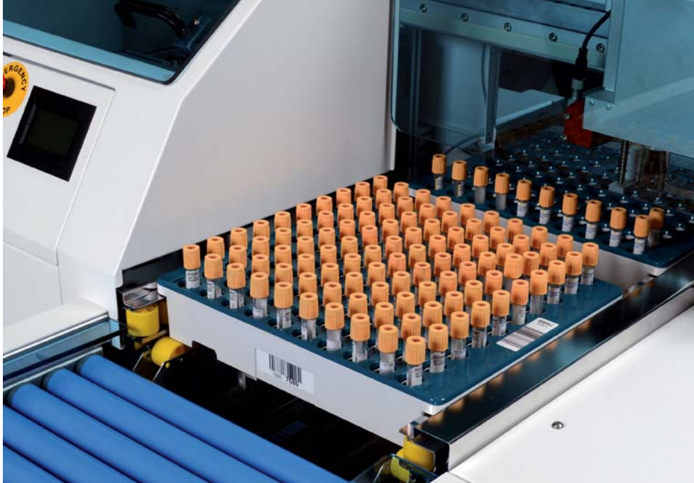
Highspeed Closed Tube Sorter HCTS2000 MK3

Laboratory logistics precisely engineered